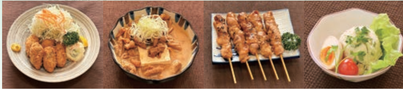
カキフライ 900円 モツ煮 700円 焼鳥 500円 自家製ポテトサラダ 550円