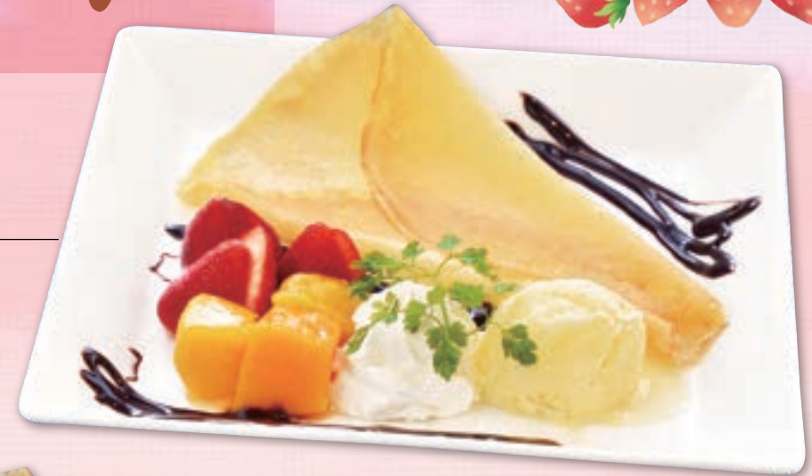
季節のフルーツと バニラアイスクレープ 850円

やわらかいクレープに 季節のフルーツと生クリームホイップ・ バニラアイスをおトッピング!