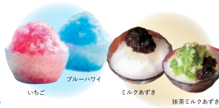
いちご 300円 いちごみるく 380円 ブルーハワイ 300円 みるくブルーハワイ 380円 ミルクあずき 380円 抹茶ミルクあずき 400円