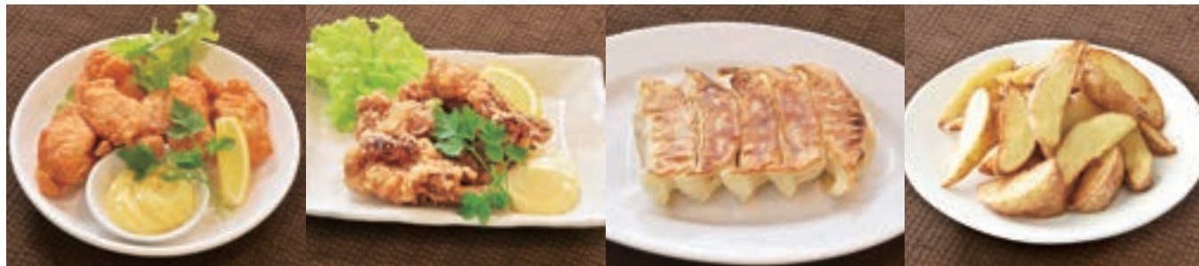
国産鶏唐揚げ 700円 イカゲソ 600円 焼き餃子[5個] 550円 ポテトフライ 500円 ハーフ 400円 ハーフ 400円 ハーフ[3個] 350円 ハーフ 300円