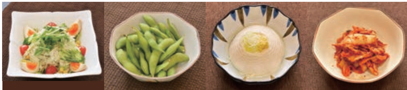
やすらぎサラダ 750円 枝豆 600円 冷奴 420円 キムチ 400円 ハーフ 450円 ハーフ 400円 ハーフ 250円 ハーフ 300円